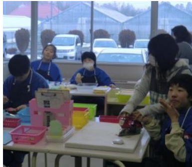
給食の牛乳パックからパルプを取り出し、メモ帳を作りました。(工芸班)