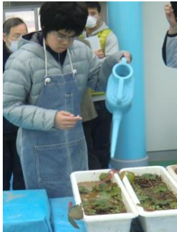
プールでイチゴの苗に水をやり、人工授粉も経験しました。(園芸班)