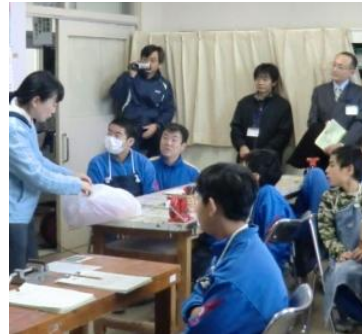
学校の桜の木の枝を加工して、願いに合わせたお守りを作りました。(木工班)