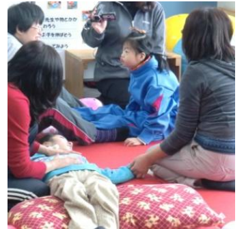
一人一人の課題に合わせて楽しく身体を動かしました。(自立活動班)