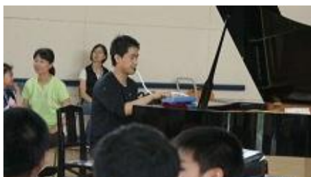
さすがプロ。これがピアノカと思うような澄んだ音色。