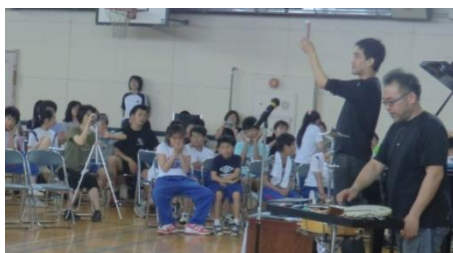
音のおまじないで、あら不思議！マジックの腕前もプロ。