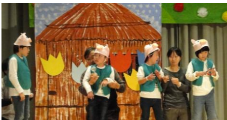
小1～4年「3びきのこぶた」

I need you 手をつなごう！！フィナーレの最後は「生きてる生きてく」のテーマ曲にのってみんなで手をつなぎ楽しく踊りました。