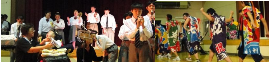
オープニング 高等部合奏「上を向いて歩こう」「生きてる生きてく」フィナーレ 高3年「夢ソーラン」