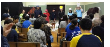
高等部「お楽しみ広場」 読み聞かせ、ゲーム、クイズ 記念撮影、ザリガニつり etc.