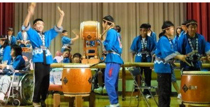
フィナーレ 中2～3年「元気太鼓」