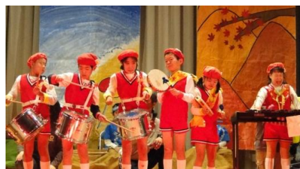
小5～6年「あつまれ！幸せ音楽隊！！」