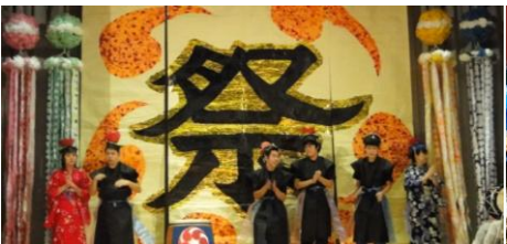
中学部「石巻六魂祭～KIZUNA 44～」