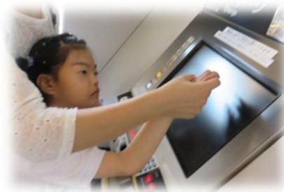
東北本線に乗りました。