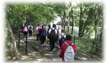
歩け歩け・・・ウォークラリー。