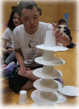
盛り上がったレクリエーション

東北本線に乗って多賀城にある東北歴史博物館を見学。そしてグランディ 21 でのレクリエーション大会やウォークラリーなど、生徒たちは普段とは異なるたくさんの経験をし、有意義な学習の機会となりました。友達とともに充実した2日間を過ごし、クラスや学年の絆もより一層深まりました。