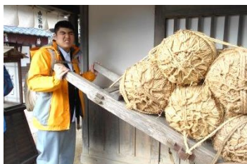
「だれか、手伝ってください。」

9:00～ ホテル発 9:30～10:30 京都市内車窓見学 12:10～13:20 伊丹空港 ～仙台空港 ～15:00 学校着