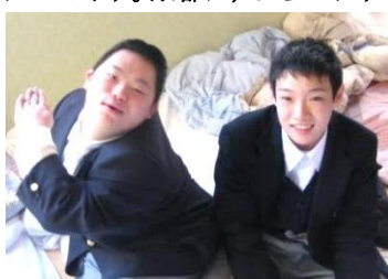
「ホテルの部屋でくつろいでます。」