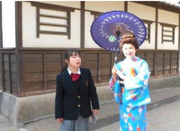
「おいでやす。京都は、よろしおすか。」